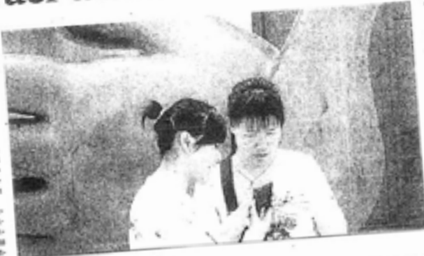
Dos turistas chinos en una ciudad andaluza.

En rueda de prensa, el concejal de Turismo del Ayuntamiento de Córdoba, Pedro García, indicó que la organización de esta jornada se realiza para "introducir que la marca Córdoba se introduzca en China, el gigante asiático". En esta ocasión, García afirmó que China "es una de las primeras potencias a nivel mundial" y destacó su importancia como motor de visitantes. Además, el concejal añadió que "Córdoba quiere situarse en pri-